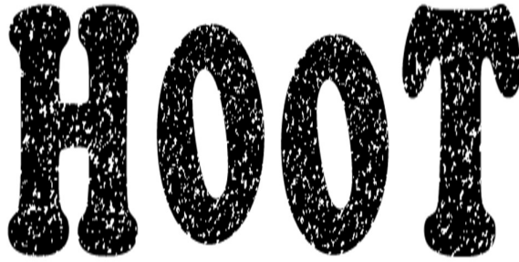
としょかんカレンダー