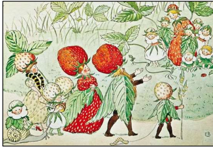
行スト:エルサ・ベスコ「ラッセのにわで」より